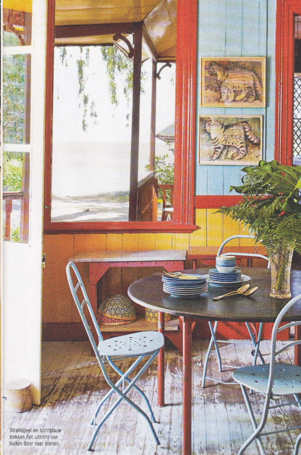
Strandgeel en luchtblauw trekken het uitzicht van buiten door naar binnen.

Een strandhuis, wie droomt daar niet van? Rosa heeft er al jaren een in de familie en maakte er een klein paradijsje van. Met een opvallende mix van felle kleuren, brocante en Afrikaanse prints geeft ze een geheel nieuwe betekenis aan de term beachlook.