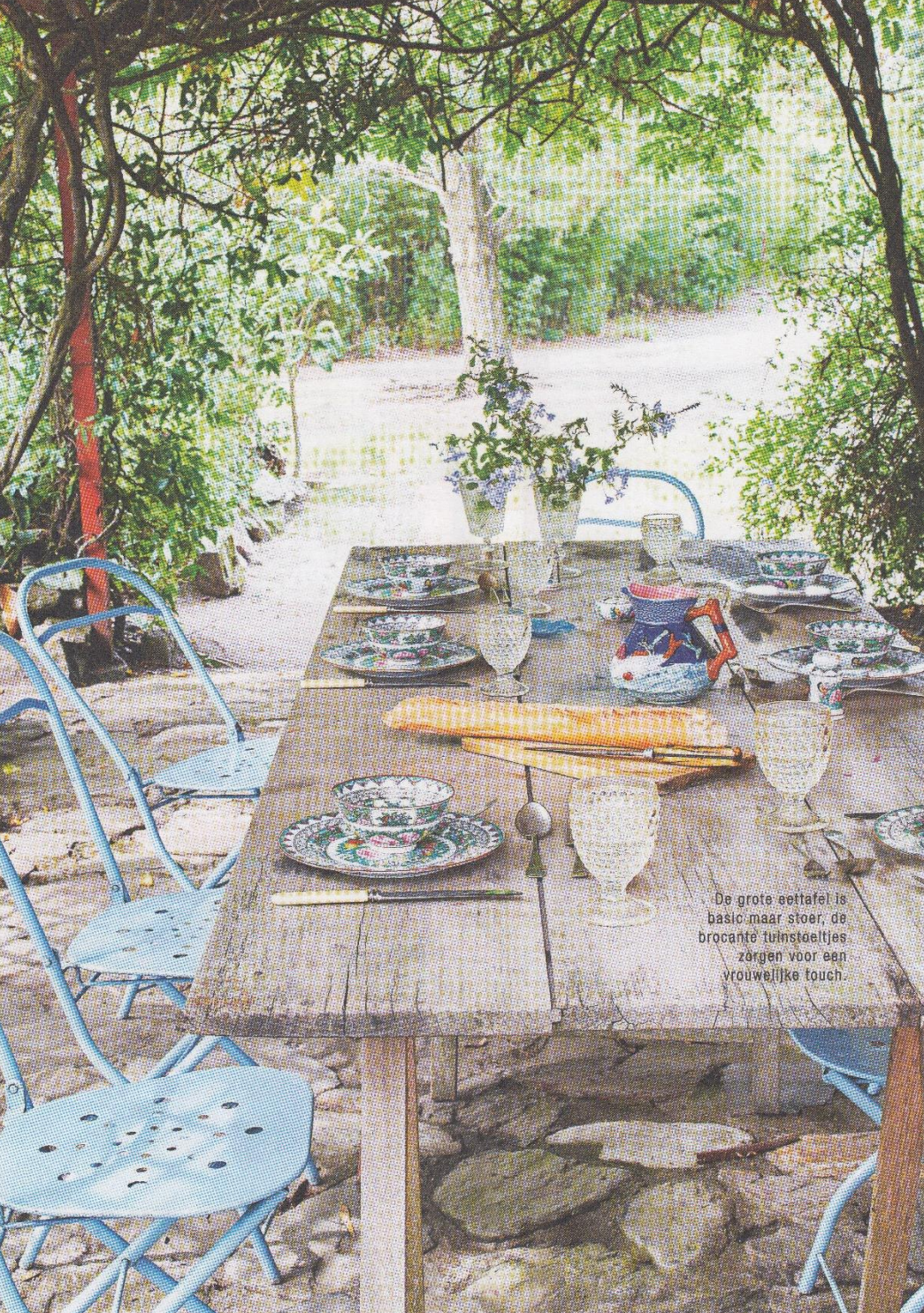
De grote eettafel is basic maar stoer, de brocante tuinmeubeltjes zorgen voor een vrouwelijke touch.